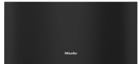
Einbau im Hochschrank